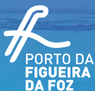
Tabela de Marés 2020